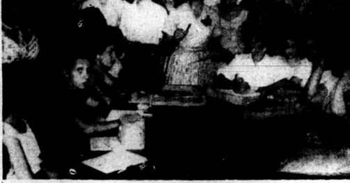
REUNESE LA SECCION FEMENINA DEL MOVIMIENTO